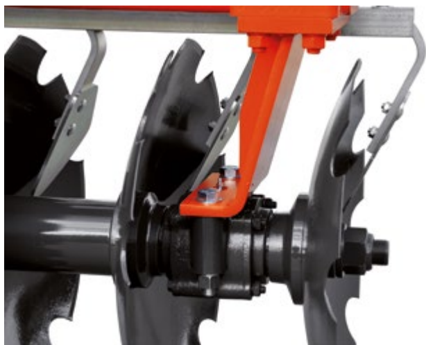
PARTICOLARE SUPPORTO PESANTE CUSCINETTO A RULLI PARTICULAR HEAVY SUPPORTS ROLLER BEARINGS