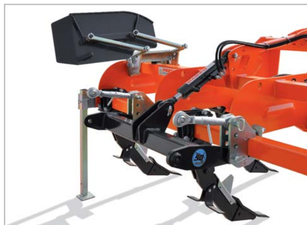
PARTICOLARE SOLLEVATORE IDRAULICO SHR-RPT KIT HYDRAULIC LIFT ADJUSTMENT SHR-RPT