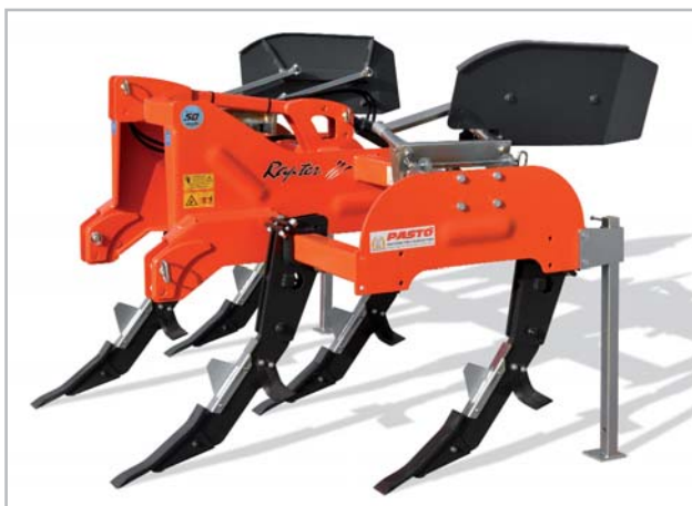
KIT SPONDINE CONTENIMENTO ZOLLE SP-002-R KIT CONTAINING FLAPS SP-002-R